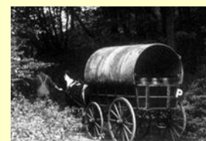
„Die Fuhrleute vom Ellersberg“