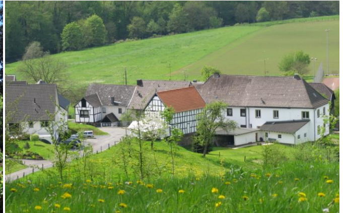
Cyriax, Wiege der Overather Geschichte