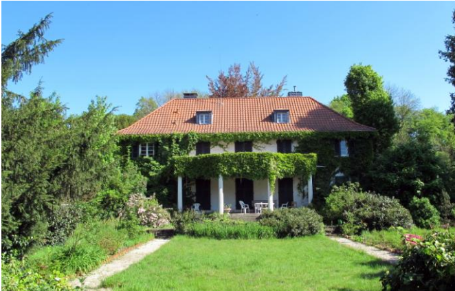
Gut Eichthal

Mit der RB 25 durch den Tunnel nach Honrath, Wanderung von Honrath über Gut Eichthal und Cyriax nach Overath